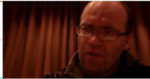
Videostill Still from video