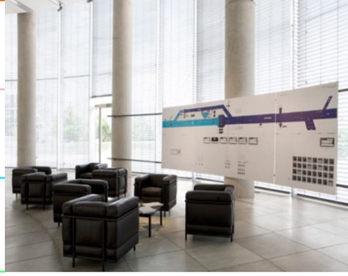
Ausstellungsansicht, Foyer der RWE AG, Essen Installation View, entrance hall of RWE AG, Essen