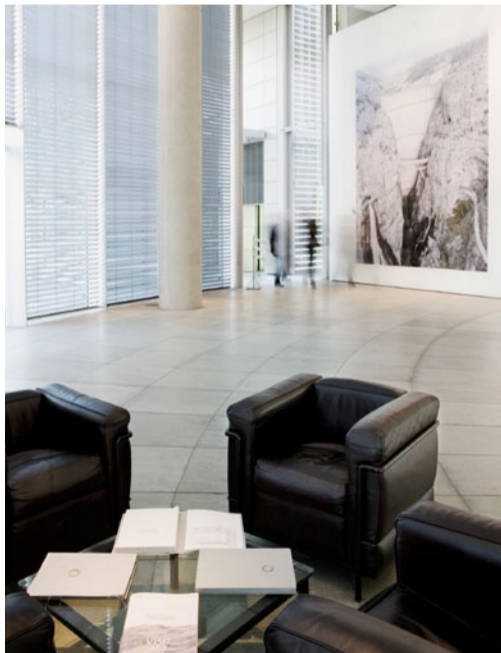
Ausstellungsansicht, Foyer der RWE AG, Essen Installation View, entrance hall of RWE AG, Essen