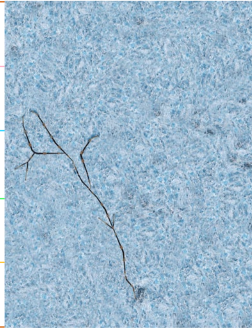
Fotomontage (Zusammenarbeit mit David Jansen) Photomontage (cooperation with David Jansen)